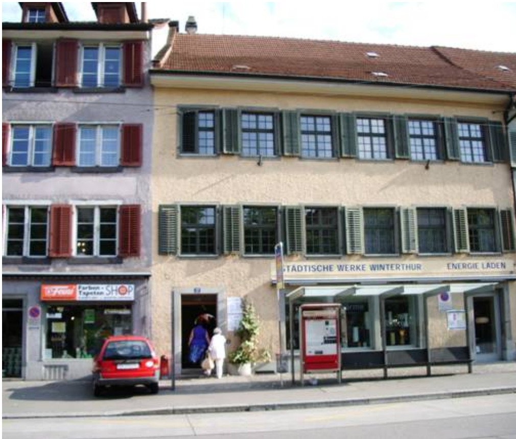
Der Empfang ist im 1. Stock